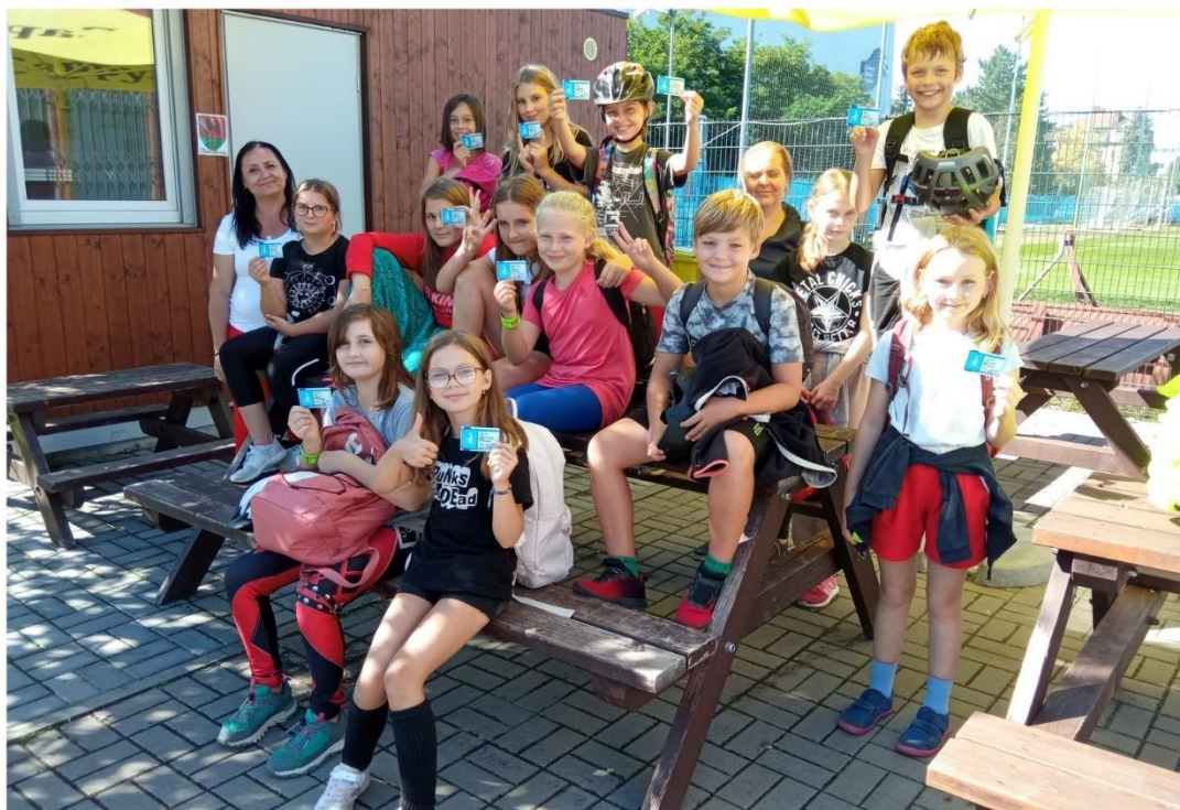
Dopravní výchova - 4.-5. ročník