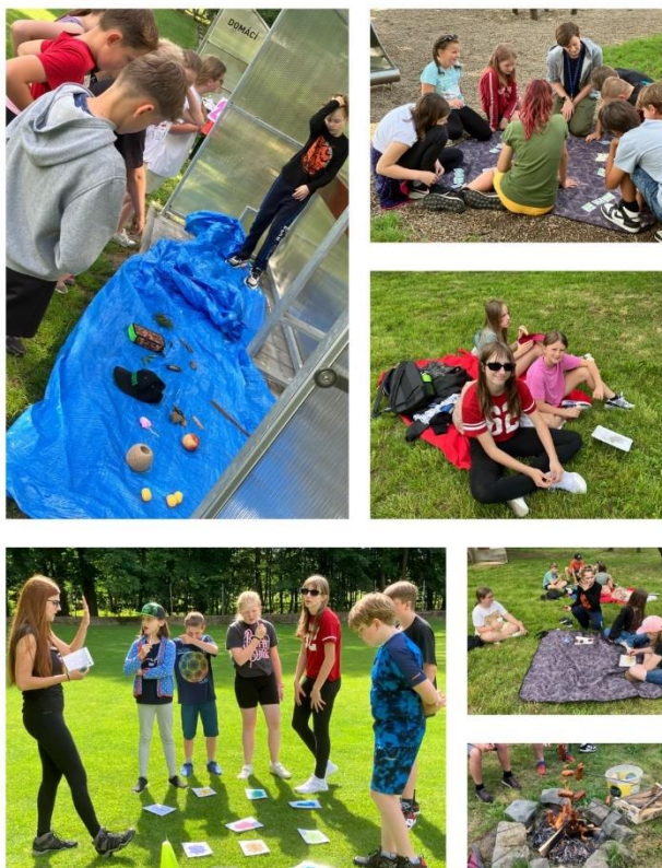
projektový den IROP