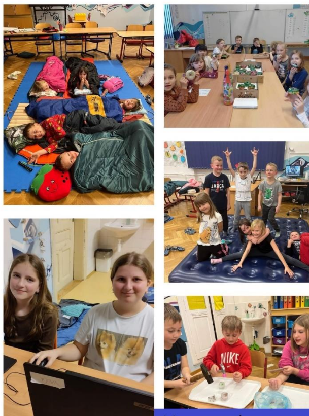
Noc s Andersenem